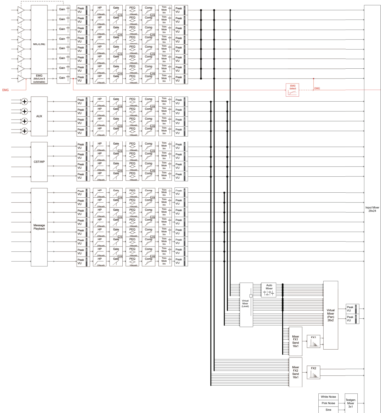
Fig. 2: Entradas DSP